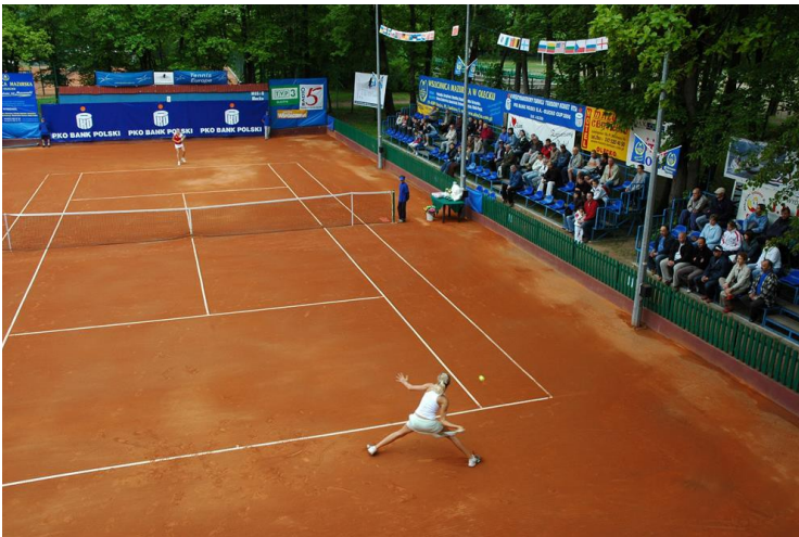
To zdjęcie kortów

MOSiR ma kąpielisko miejskie, gdzie możesz latem korzystać z kilku obiektów: