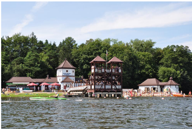
To zdjęcie plaży zwanej Skocznia.